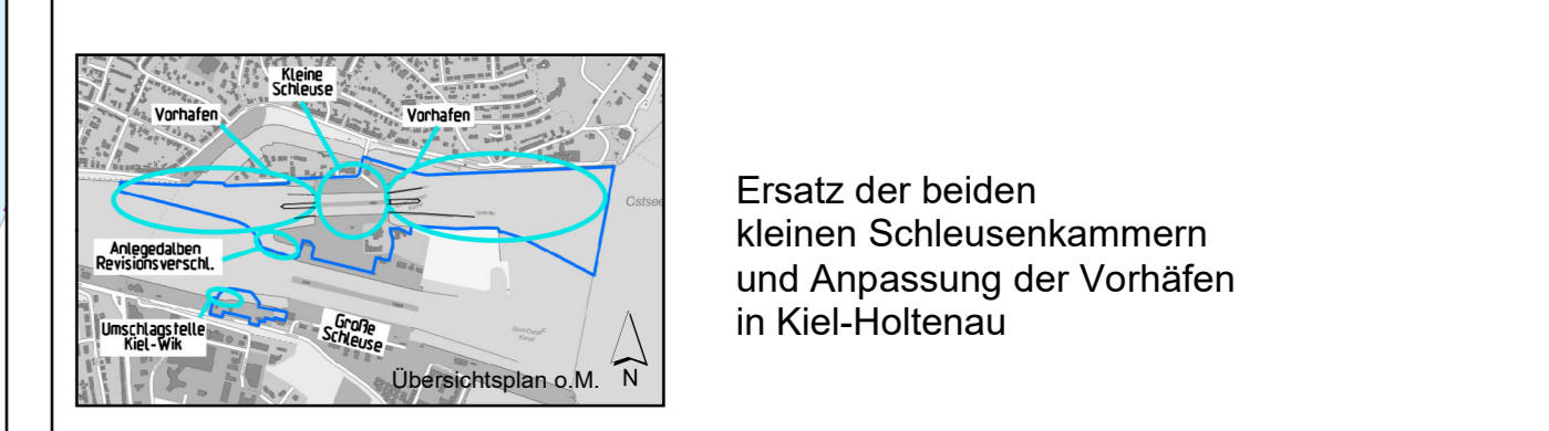
Ersatz der beiden kleinen Schleusenammern und Anpassung der Vorhöfen in Kiel-Holtenau

Erläuterungen zur Legende: Kleine Symbole = Kennzeichnung des Standortes Große Symbole = Die Pflanze ist in diesem Bereich auf einer größeren Fläche regelmäßiger Bestandteil der Grasnarbe Rote-Liste Kategorien: 2 = stark gefährdet 3 = Gefährdet G = Gefährdung anzunehmen V = Vorwarnliste